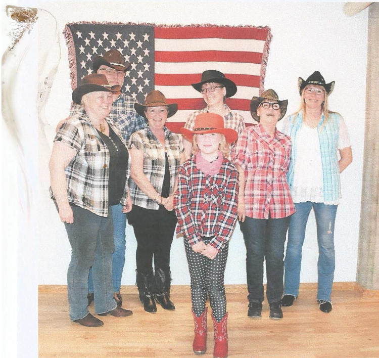
★ En glad flok damer så gerne, at flere yngre dansere meldte sig til linedance.