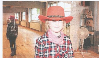
★ En lækker hat, er et must som linedancer.